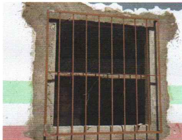
Foto 2 - Visão externa do PSF Riacho de Pedra detalhe da grade da janela