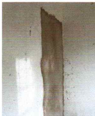
Foto 4 - Visão interna do PSF Riacho de Pedra fechamento da parede e emboço