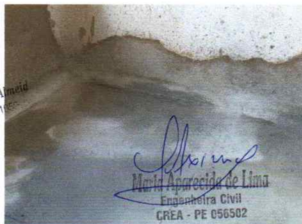
Foto 6 - Visão interna do PSF Riacho de Pedra detalhe do piso e revestimento de parede

Ítalo Henrique C. de Almeida Eng. Civil - CREA-PE 11655