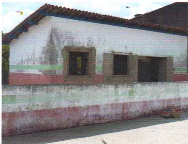
Foto 1 - Visão externa do PSF Riacho de Pedra grades nas janelas e emboço externo