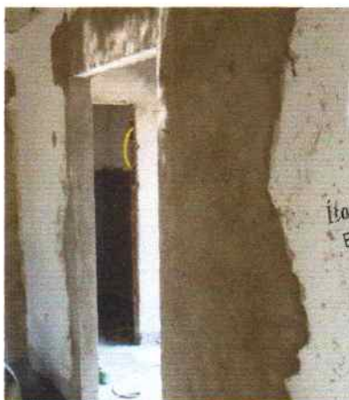
Foto 5 - Visão interna do PSF Riacho de Pedra revestimento das paredes